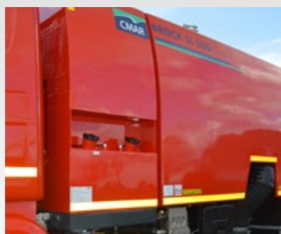
CUVE À EAU DERRIÈRE LA CABINE