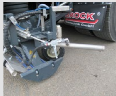
RAMPES HAUTE PRESSION LATÉRALES