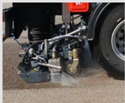
LAVAGE THP ASPIRE-GRAVILLONS