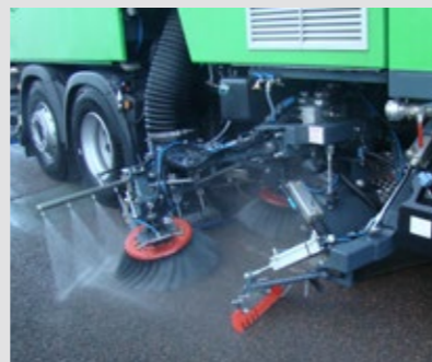
GRATTOIR ET RAMPE DE LAVAGE SUR GROUPE DE BALAYAGE