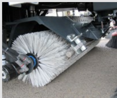
BALAI CENTRAL TIRÉ FLOTTANT AVEC RAMPE DE LAVAGE