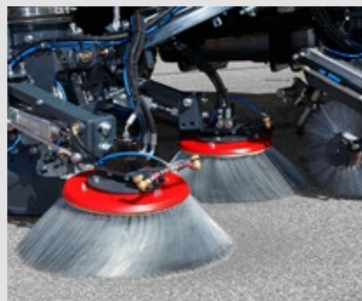
DOUBLE BROSSES DE BALAYAGE