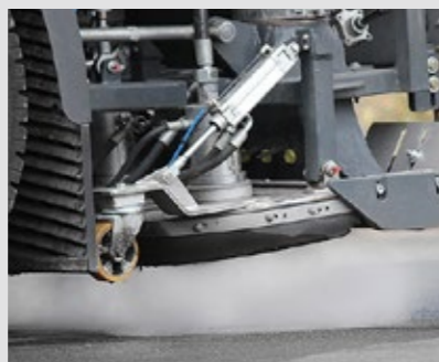
CLOCHE DE DÉCAPAGE ARRIÈRE