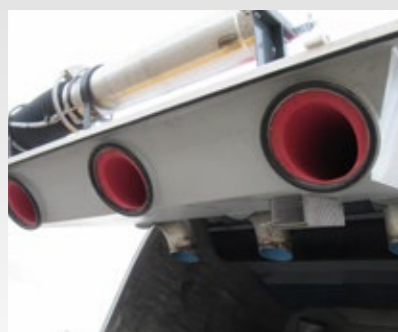
TUBES VULCANISÉS INTÉGRÉS À LA PORTE ARRIÈRE