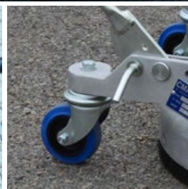
Roulettes de direction