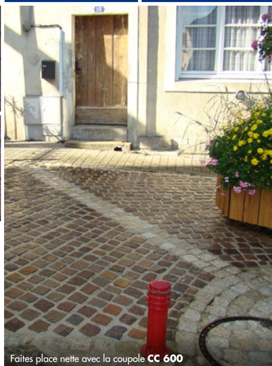
Faites place nette avec la coupole CC 600