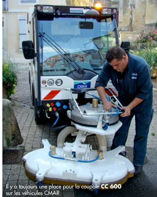
Il y a toujours une place pour la coupole CC 600 sur les véhicules CMAR

Utilisable avec toute source d'eau chaude ou d'eau froide haute pression, elle assure une propreté parfaite aussi bien à proximité du mobilier urbain qu'en site industriel.