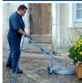
Maniable, la CC 600 contourne aisément les obstacles