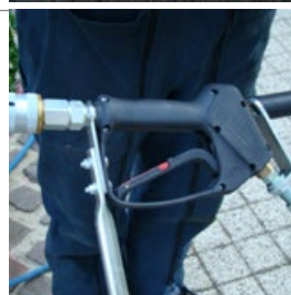
Détail de la poignée