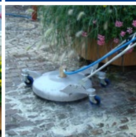
Efficacité accrue avec source haute pression eau chaude