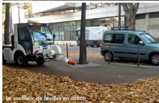
Le souffleur de feuilles en action